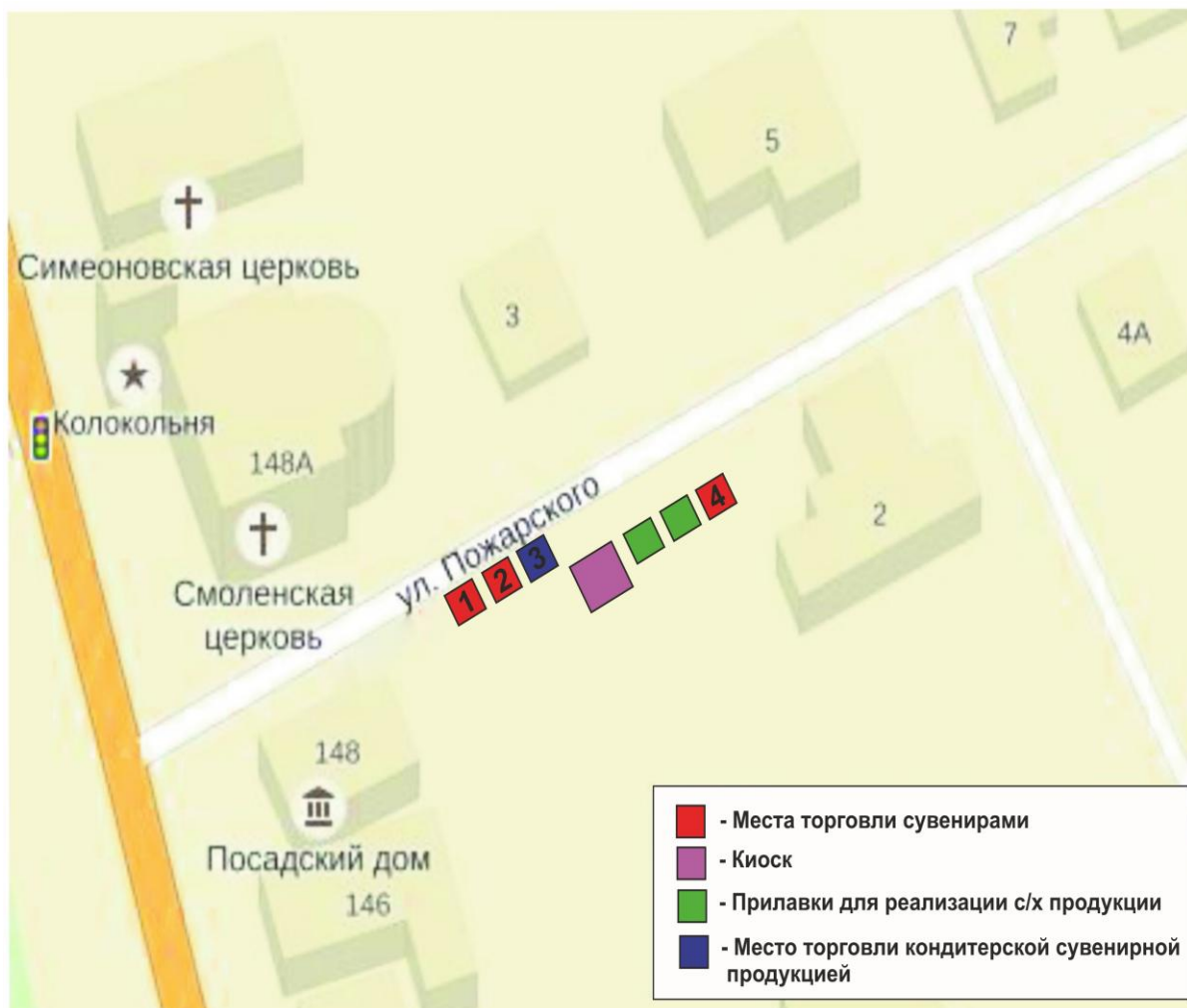
СХЕМА размещения торговых мест на специализированной ярмарке в муниципальном образовании город Суздаль