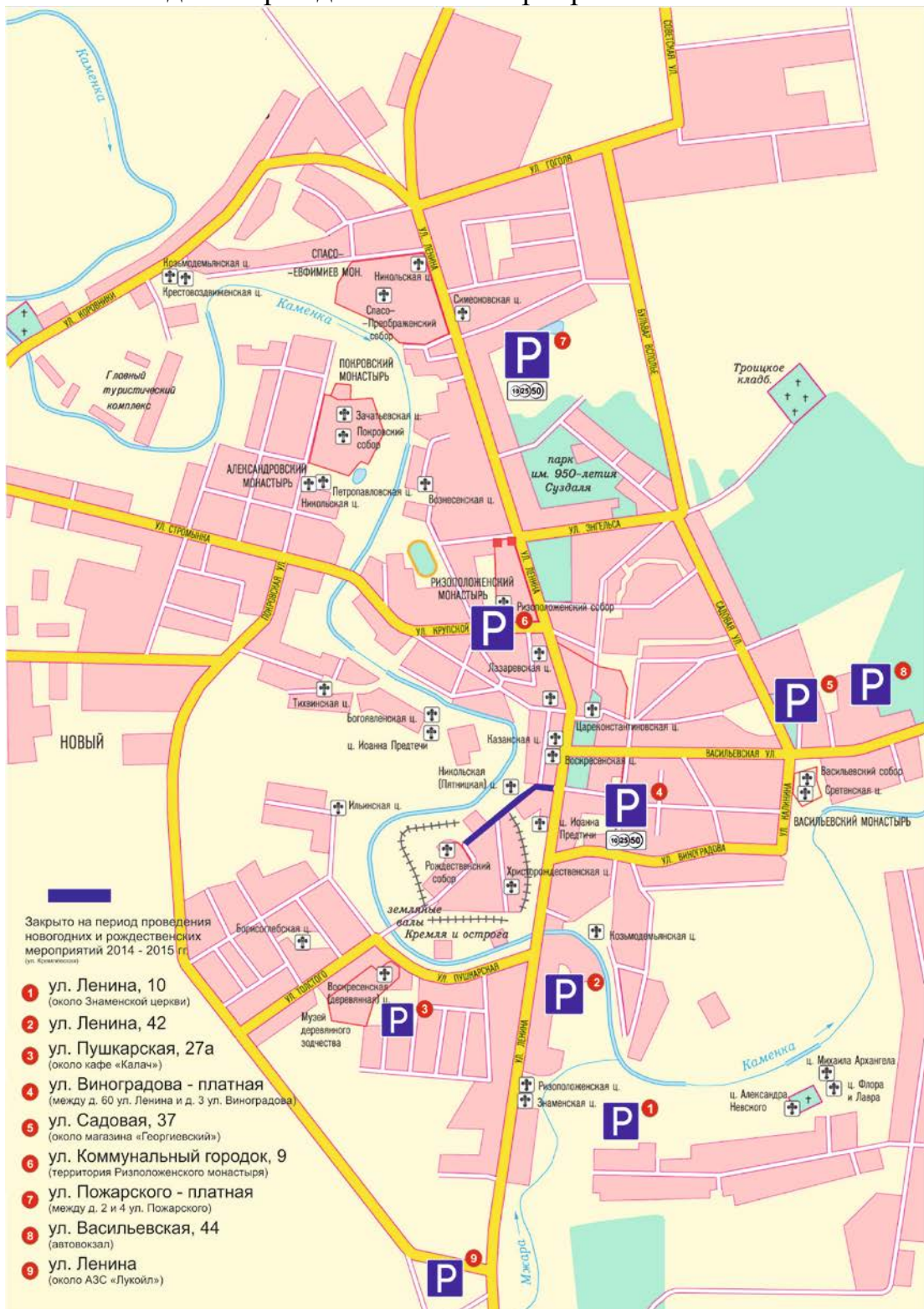
Схема расположения автомобильных стоянок в г. Суздале на период проведения новогодних и рождественских мероприятий 2016 - 2017гг.